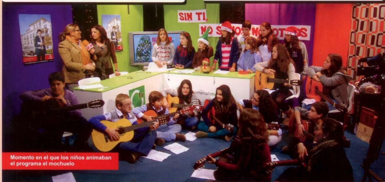
Momento en el que los niños animaban el programa el mochuelo