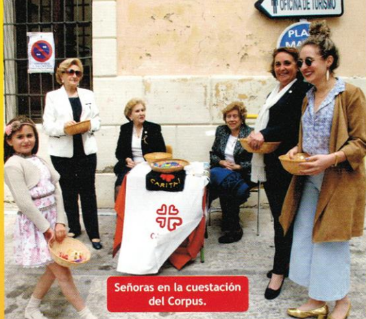
Señoras en la cuestación del Corpus.