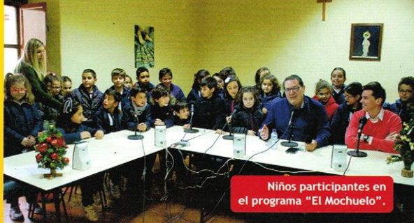
Niños participantes en el programa "El Mochuelo".

GRACIAS, SIN VOSOTROS NO LO HUBIÉRAMOS CONSEGUIDO.