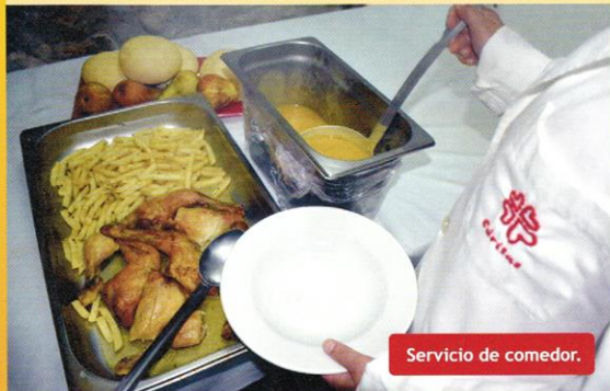
Servicio de comedor.

Un año más el “Ilustre Colegio de Abogados de Cáceres” ha tenido a bien seleccionar nuestro proyecto, junto con otros presentados por otras entidades, y repartir para todos, el 0,7 de su presupuesto. Esta cantidad ha sido añadida a los ingresos de este programa, ya que el gasto ha sido de 12.518,77. Aunque hemos tenido algunas bajas, el comedor ha atendido a 6 adultos y 6 niños. Estas bajas se han producido porque algunos de nuestros usuarios han encontrado trabajo, o han marchado a residencias.