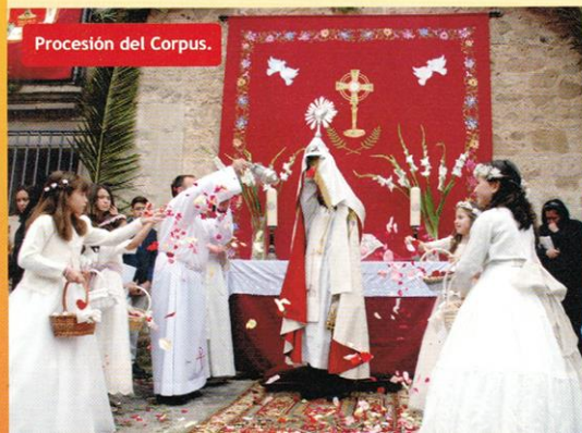
Procesión del Corpus.