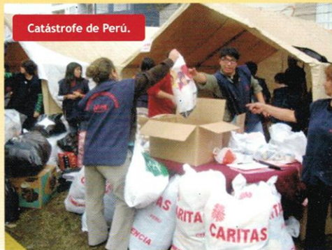
Catástrofe de Perú.

En estos momentos nos hemos unido a la campaña que recoge fondos para ayudar a Perú y al cuerno de África.